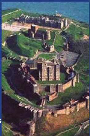
le château du XIIe siècle

Promenez vous sur les falaises mondialement connues et jetez un coup d'oeil sur la France: faites une pause au café et dégustez –y une boisson ou un repas.