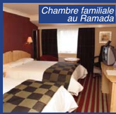
Chambre familiale au Ramada