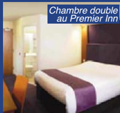
Chambre double au Premier Inn