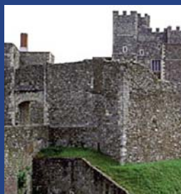
Le magnifique château de Douvres

Il existe de nombreux événements durant tout l'été pour faire de Douvres, le lieu à visiter : courses, fête de la bière, weekends WWII, Régate, carnaval, musique dans le parc et bien sur les célébrations de Bleriot en juillet. Événements du château de Douvres.